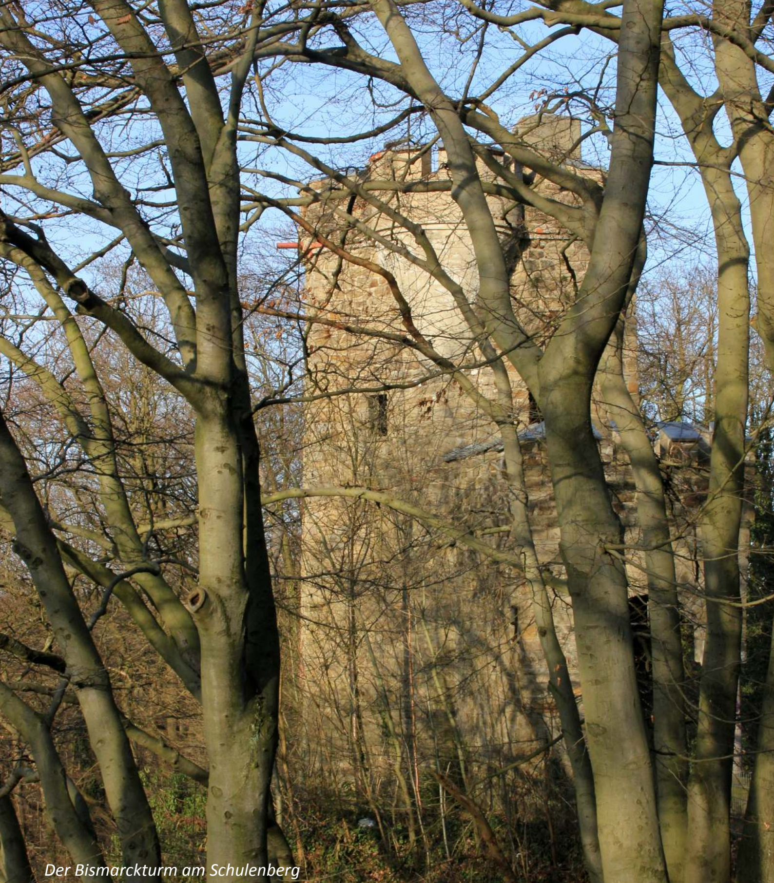
Der Bismarckturm am Schulenberg