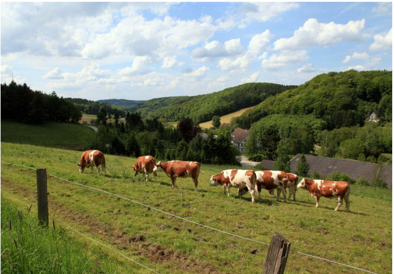
Blick ins Porbecker Tal mit dem „Waldhof“ im über 200 Jahre alten Fachwerkhau. Porbecker Tal with the beautiful half-timbered house of the "Waldhof".