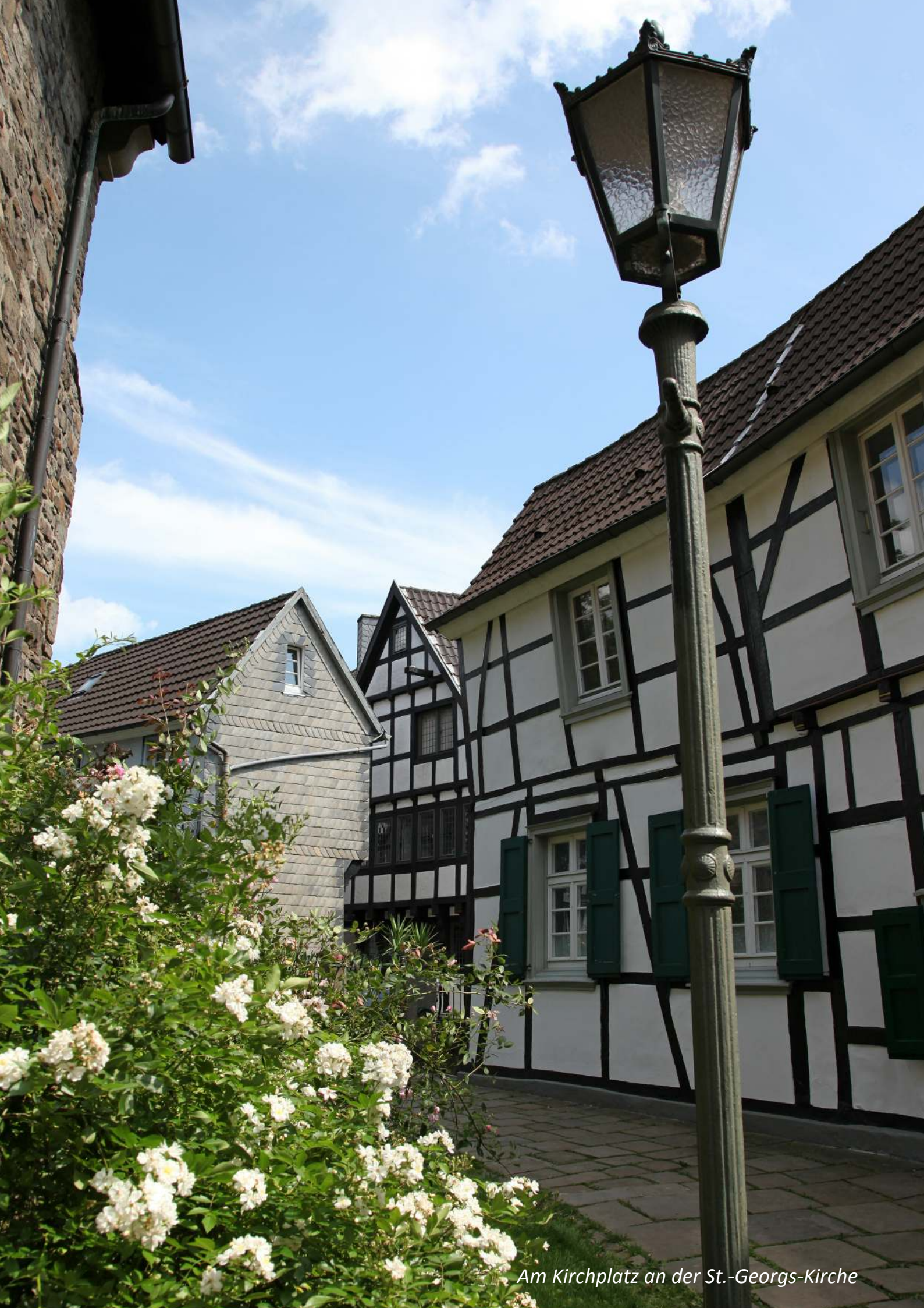
Am Kirchplatz an der St.-Georgs-Kirche