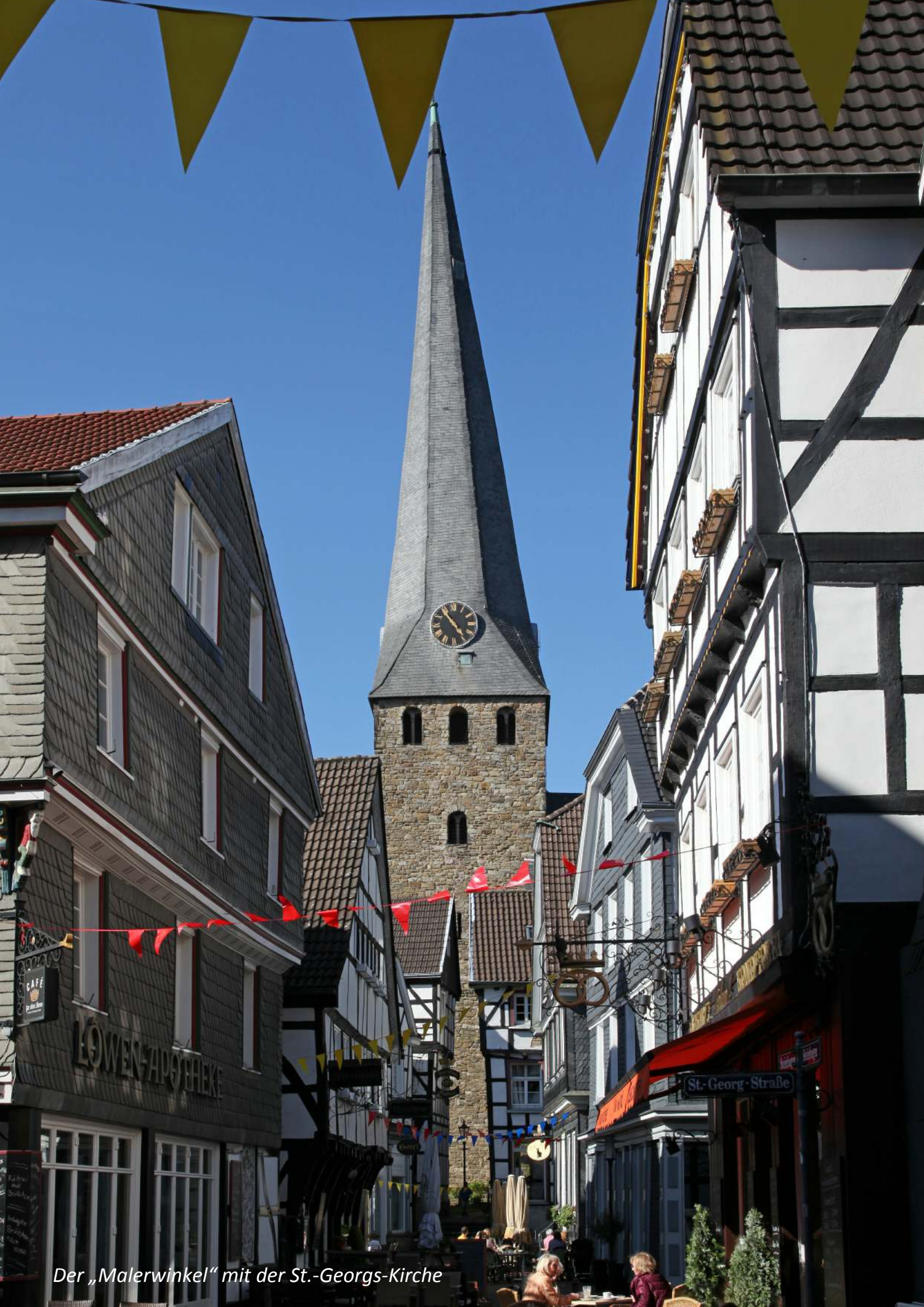
Der „Malerwinkel“ mit der St.-Georgs-Kirche