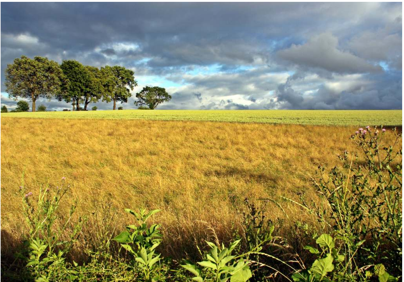
Stimmungsvoll und beeindruckend: sommerliche Impression bei Kühls, Nähe Felderbachstraße. Summery mead at Kühls on the edge of Felderbachstraße.