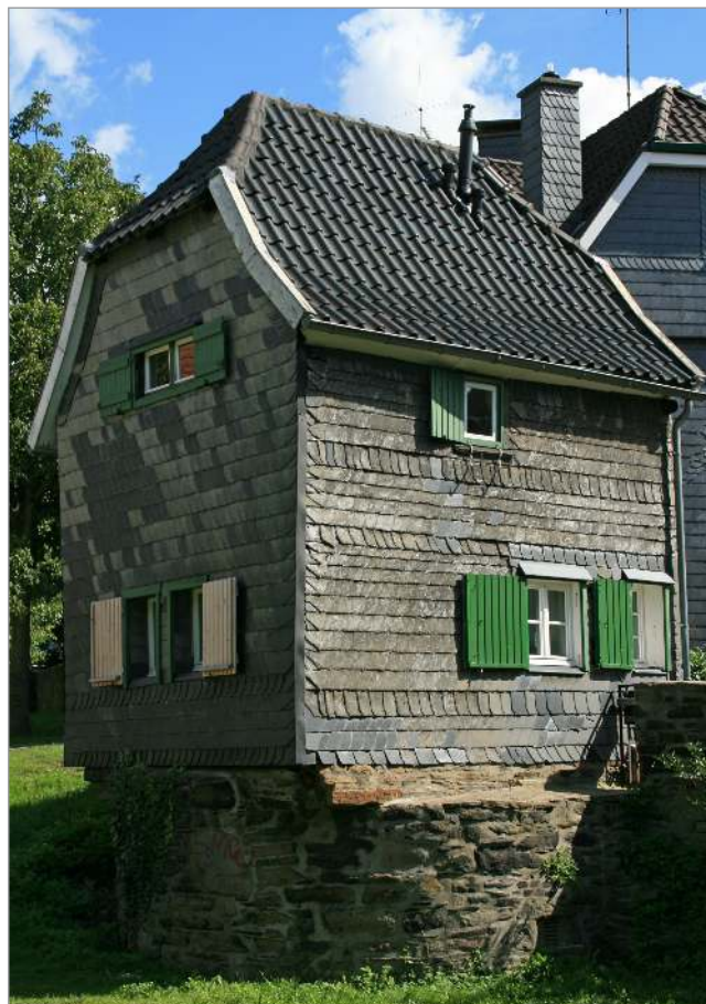
Das „Zollhaus“ wurde auf den Grundmauern eines Wehrturms errichtet. Hattingen's smallest half-timbered house: The "Zollhaus" (Customs House).

Im Zentrum der Altstadt die Sankt-Georgs-Kirche, die nach dem Brand von 1424 wieder aufgebaut wurde. Mit ihrem schiefen Kirchturmdach – jenem gotischen Spitzhelm, der sich stark nach Südwesten neigt – ist sie ein Wahrzeichen Hattingens. Das „Bügeleisenhaus“ von 1611 mit Museum, das Alte Rathaus von 1576, die Lateinschule von 1721 oder das kleine, nach 1820 errichtete Zollhaus: alles unbedingt sehenswert. Der Treidelbrunnen (1988 erbaut) am Obermarkt erinnert an die Bedeutung der Ruhr als Transportweg, bis hier um 1890 die Schifffahrt eingestellt wurde. Wer mehr wissen will, kann einem ausführlich beschilderten Stadtrundgang folgen oder sich einer Führung anschließen. Unvergesslich bleiben wird bestimmt jedem Besucher das Altstadtfest im Frühsommer oder der Weihnachtsmarkt in der Adventszeit in geradezu märchenhafter Atmosphäre. In den 1950er-Jahren wurde die Südstadt erbaut, denn nach dem Krieg benötigte Hattingen dringend neuen Wohnraum. Etwas außerhalb, unweit der Ruhr, liegt der alte Bahnhof, an dem noch die S-Bahnlinie verkehrt. Dort machen aber auch die historischen Züge und Dampflok der museal betriebenen RuhrthalBahn Station – und da mitzufahren ist ganz sicher ein weiteres Highlight.