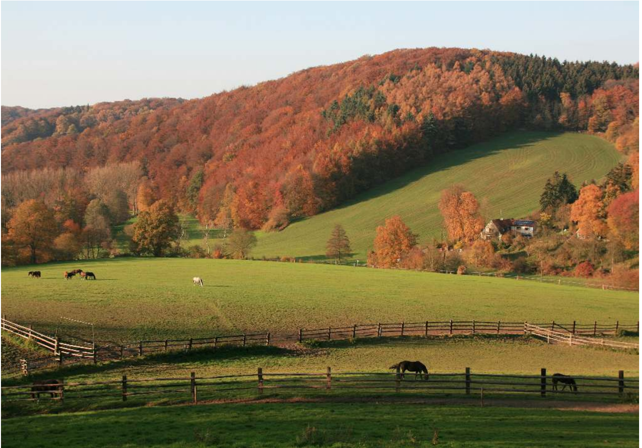
„Indian Summer“ am Rande der Elfringhauser Straße. "Indian Summer" a little off Elfringhauser Straße.