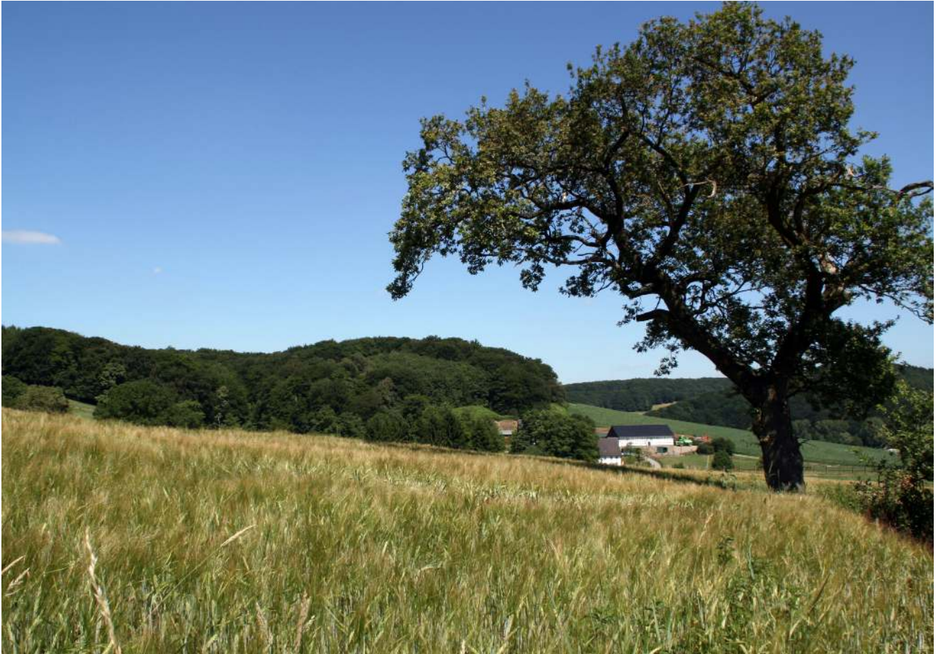
Auch in Niederelfringhausen wird man mit herrlichen Landschaftsbildern verwöhnt, wie hier rund um den Rischenhof. Gorgeous scenery with view of the Rischenhof in Niederelfringhausen.